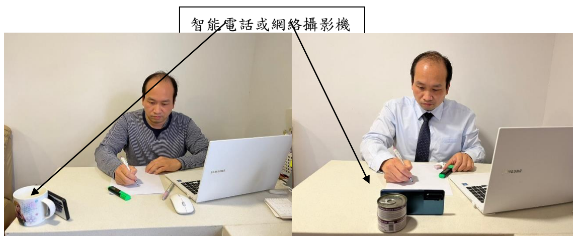
圖一 智能電話放置角度：智能電話需置於座位正前方 0 至 45 度角方向(左或右均可)，並能清楚展示枱上作答紙張及附近環境。